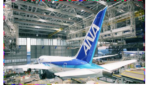
上記写真はイメージ

本シンポジウムでは、MROビジネスを取り巻く現状と課題を、行政、有識者、メーカー、ユーザー等、各立場のパネリストからお話し、理解を深め、新たなビジネス拡大への一助といたしたく存じます。この機会に是非ご参加ください。