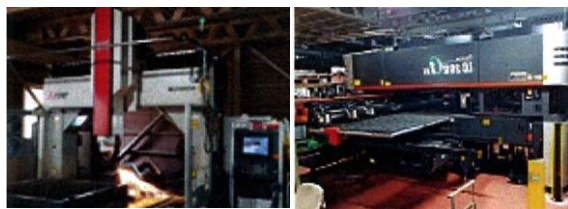
高木工業(株) (板金加工)