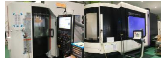
(株)オーム技研 (機械加工)