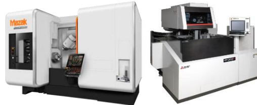
(株)石金精機 (機械加工)