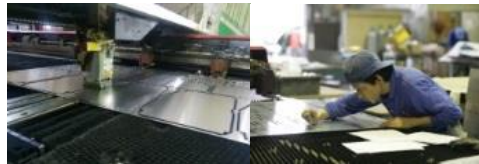
(株)毛戸製作所 (板金加工/溶接/組立)