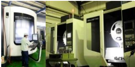
曙工業(株) (機械加工)