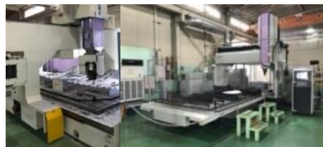
鳥羽工研(株) (機械加工/板金加工/熱処理)