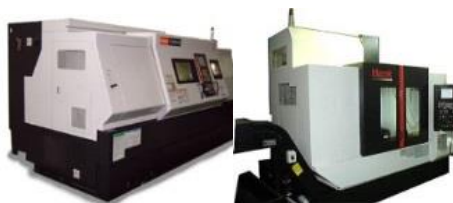
三洋機工(株) (機械加工/組立)