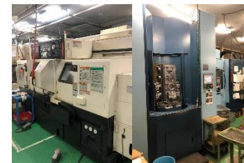
(株)名高精工所 (機械加工/組立)