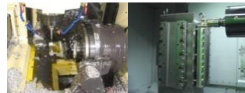
(株)シナジー (機械加工)