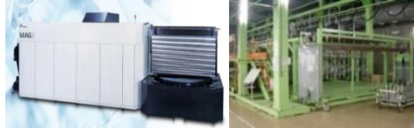
旭金属工業(株)(機械加工/非破壊検査/表面処理・塗装/組立)