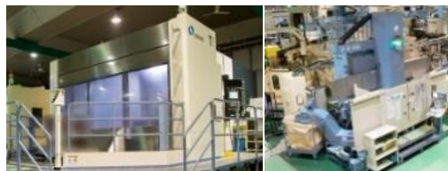
ミツ精機(株) (機械加工)