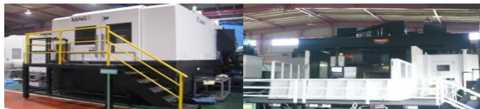
協立機興(株) (機械加工)