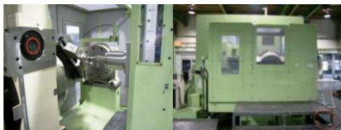
(株)桜井製作所 (機械加工)