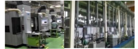
秋田精工(株) (機械加工/非破壊検査/表面処理/組立)