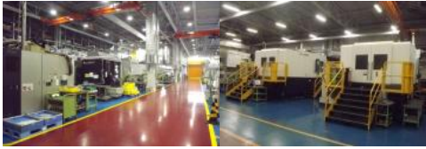
アイコクアルファ(株)(機械加工)